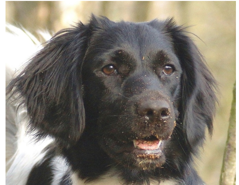
Stabijhoun (Chien d'Arrêt Frison)