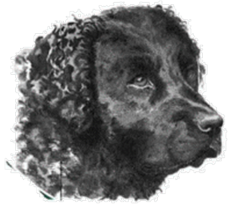
Wetterhûn (Perro de agua Frisón)